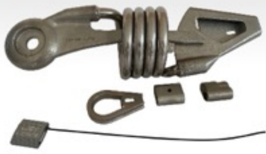
Passant OH à cintrer OH08

DANS CERTAINS CAS, POUR AMÉLIORER LA CIRCULATION DES NAVETTES, IL EST NÉCESSAIRE D'AUGMENTER LA TENSION DU CÂBLE EN UTILISANT UN ABSORBEUR OH.